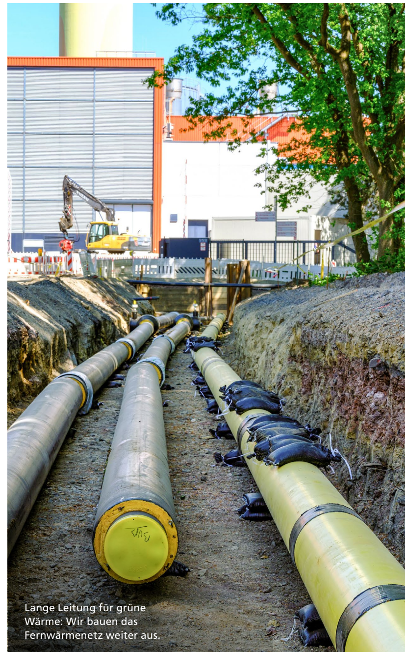
Lange Leitung für grüne Wärme: Wir bauen das Fernwärmenetz weiter aus.